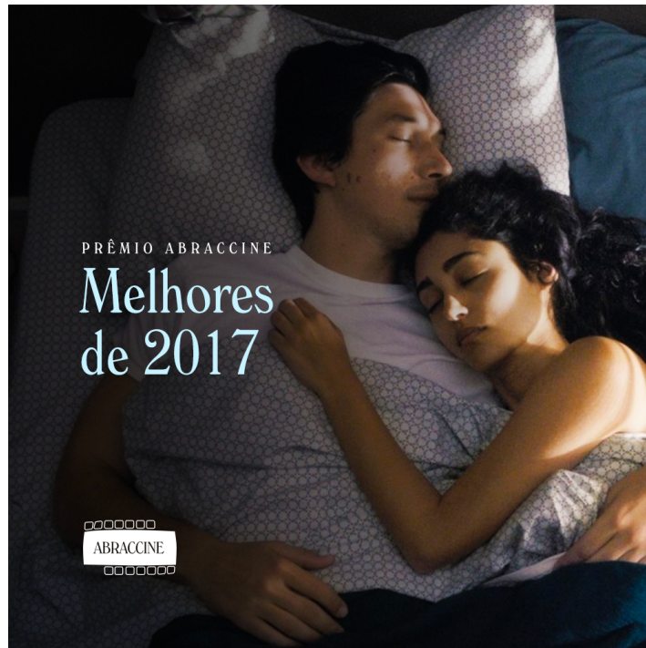
Exemplo de post para redes sociais